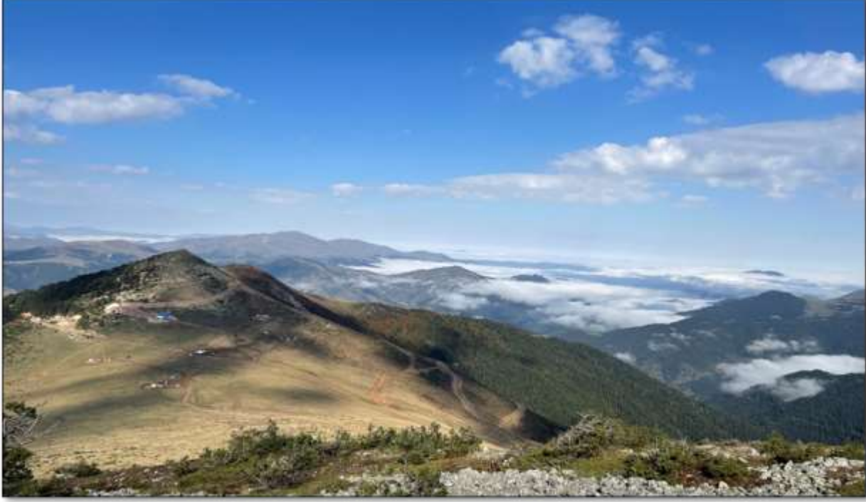
2021 Yılı Sondaj Çalışması Görüntüsü.