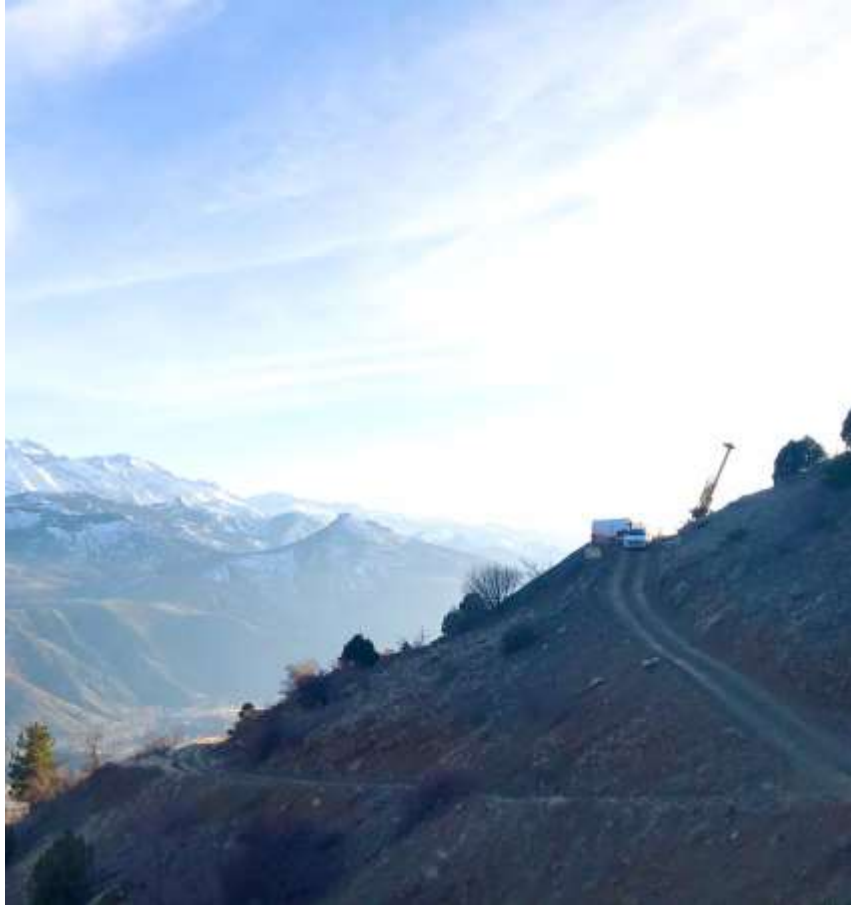
EDDH043 Nolu Sondaj Kuyusunun Uzaktan Görünümü

Elmalı mineralizasyonunda öncel çalışmalar süresince faaliyeti yapılmış olan dere kumu örnekleme çalışması ve alınan örnekler örneklerin alındığı noktalar tekrar incelenmiş ve değerlendirilmiş olup eksik kalan daha önce örnekleme çalışması yapılmayan derelere üzerinden tekrar bir planlama yapılmış dere kumu örnekleme çalışmasına başlanmış toplam 45 örnek alınmıştır. Örnekleme çalışmasına plan doğrultusunda devam edilecektir.